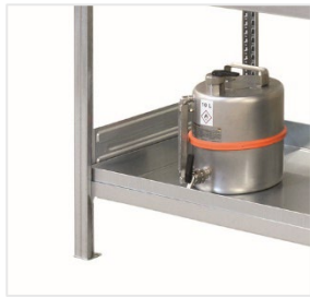
11189 / 11190