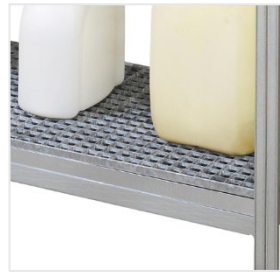
11193 / 11194